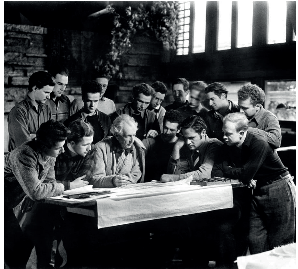
Frank Lloyd Wright coi suoi studenti nella scuola di architettura da lui fondata a Taliesin. Dicembre 1937.